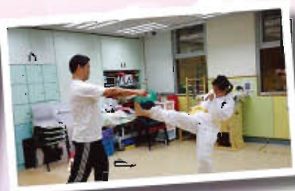
「我哋升級試成功咗喇!」，下個目標為匯演努力練習踢板。