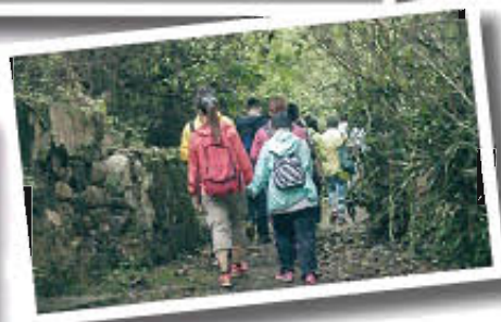
傷健人士一同互相扶持尋找隱世曝罟灣!