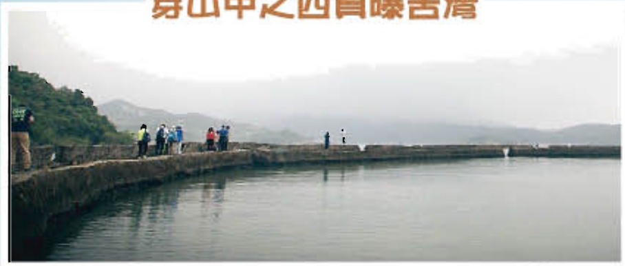
穿山甲行山隊又出發啦!!